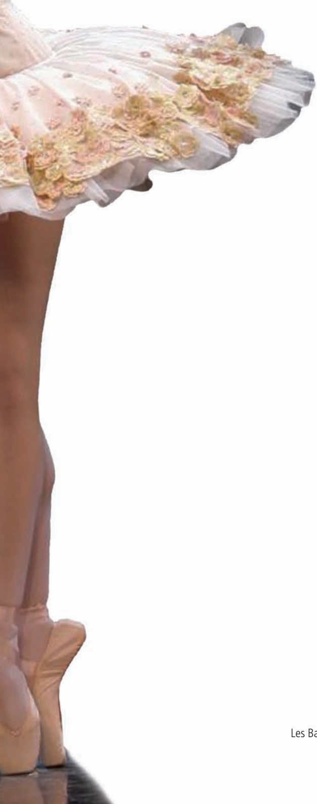
in copertina Les Ballets Trockadero de Monte Carlo (Swan Lake)